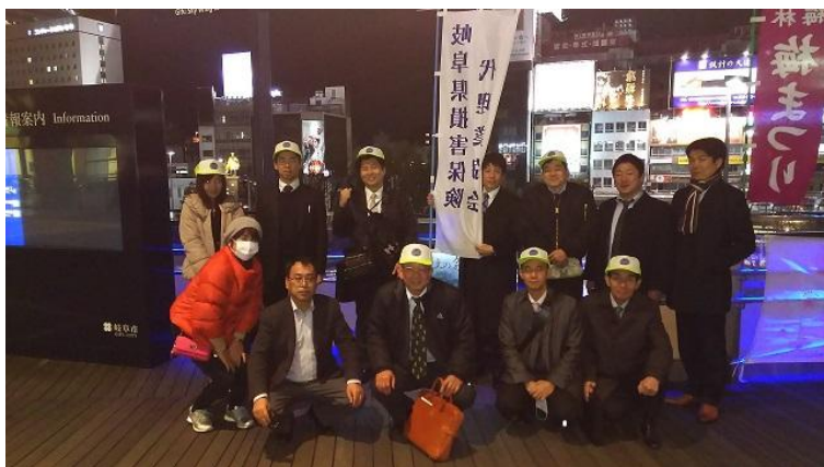
(岐阜支部 JR岐阜駅前)

岐阜支部、西濃支部、中濃支部、東濃支部、飛騨支部において地震保険キャンペーンを開催しました。多くの会員の皆様の参加により、素晴らしい地震保険普及活動を行うことができました。当日は春の寒さの中、とても大変なキャンペーン活動になりました。ありがとうございました。ご協力いただきましたみなさまに感謝いたします。