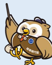
ふうた (代協キャラクター)