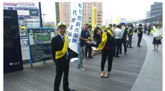
(JR岐阜駅前 活動風景)