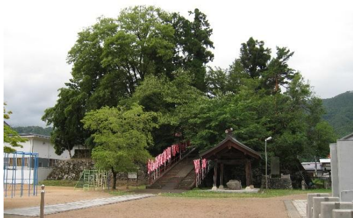
（増島城跡に建つ御蔵稲荷神社）

飛騨国府はどこにあったのだろうと推理しながら進むと、越中西街道（飛騨街道西道）は、やがて飛騨市古川町に入ります。風情が残る栗原神社あたりを過ぎると古川の市街地に入り、まもなく宮川の支流荒城川に架る霞橋に着きます。