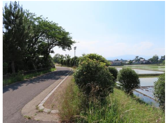
（美濃路は輪中堤を通る）

そのうち東側の堤は古くからあつたようで、南側は徳川幕府によって築かれ、西側は「尉堤（じょうどのつつみ）」といわれるように黒野藩主加藤左衛門尉貞泰が築いたものです。ちなみに、「尉堤」は、岐阜市の岐阜北高校北側あたりにもあります。それはともかく、美濃路は水害で苦しめられた地域を通過していたのです。まもなく、美濃路は、そんな輪中堤にある東結一里塚跡に着きます。