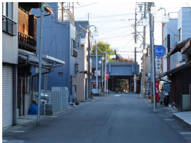
（萩原宿のまちなみ）

美濃路に戻ります。変則4叉路を左折、つまり東に進み日光川にかかる、かつては古川橋といった萩原橋に着きます。萩原川とか萩原古川と呼ばれていた日光川は、現在、大きめの用水路のような景観ですが、かつて木曾川主流の一つの流れで川幅が480メートルもあったといえます。