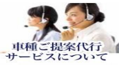
車種ご提案代行 サービスについて

あらかじめ打ち合わせした車輛返却の日時に、お客様ご指定の場所迄レンタカーをお引き取りに伺います。