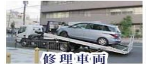
修理車両 レッカーサービス

スタッフがご担当者様に代わり代車をご利用になるお客様と直接お車の選定についてお話しすることも可能です。