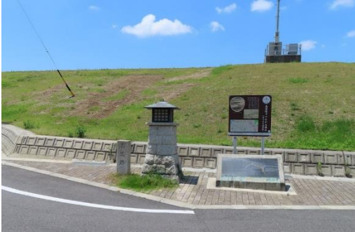
（庄内川左岸の石碑等）

美濃路は、庄内川に架かる枇杷島橋に到着します。江戸時代の橋は、現在の橋の上流、川の真ん中にある小島を挟んで、尾張一という大小の総檜づくりの橋が架けられていました。ここからは伊吹山、金華山や御岳山、そして、東には名古屋城が眺められ名所となっていました。ちなみに庄内川は岐阜県恵那市の夕立山