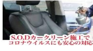
S.O.Dカーキリーニング施工で コロナウイルスにも安心の対応