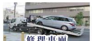
修理車両 レッカーサービス

スタッフがご担当者様に代わり代車をご利用になるお客様と直接お車の選定についてお話しすることも可能です。