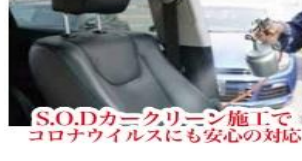
S.O.Dカーキリーニング施工で コロナウイルスにも安心の対応