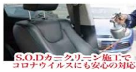
S.O.Dカークリーニング施工で コロナウイルスにも安心の対応