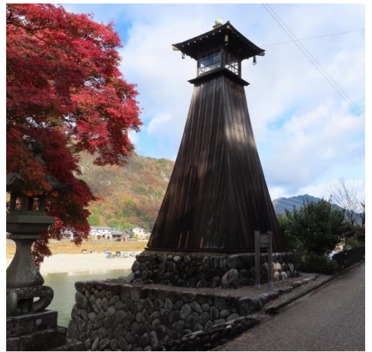
（上有知湊の川灯台）

さて、郡上街道は、うだつの建物が並ぶ街並みを離れ、武儀高校の西側から美濃小学校へ西進し、坂道となっている国道156号線を下り曾代に入り、すぐ、東に折れて、美濃消防署の東側の道あたりに至っていたのではないかとされています。