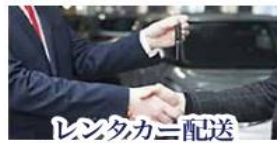
レンタカー配送 お引取りサービス

100台以上の保有台数で国産車から輸入車、4WD車、トラック、福祉車両までニーズ合わせたレンタカーをご準備致します。