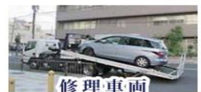
修理車両 レッカーサービス

スタッフがご担当者様に代わり代車をご利用になるお客様と直接お車の選定についてお話しすることも可能です。