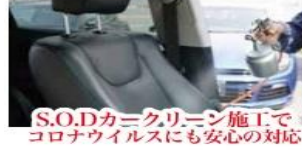
S.O.Dカークリーニング施工で コロナウイルスにも安心の対応