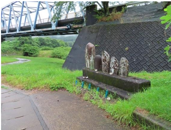
（上河知渡し場跡の石仏群）

郡上街道左岸（東岸）ルートは、かつて立花の渡しがあった立花橋から長良川の左岸、保木脇（美濃市）をしばらく進みます。このあたり国道 156 号や長良川鉄道を通っていますが、郡上街道左岸（東岸）のルートは定かではありません。さらに長良川に架る東海北陸道や長良川鉄道の鉄橋の下を潜り、国道 156 号の新立花橋に着きます。