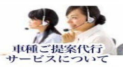
車種ご提案代行 サービスについて

あらかじめ打ち合わせした車輛返却の日時に、お客様ご指定の場所迄レンタカーをお引き取りに伺います。