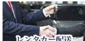
レンタカー配達 お引取りサービス

100 台以上の保有台数で国産車から輸入車、4WD 車、トラック、福祉車両までニーズ合わせたレンタカーをご準備致します。