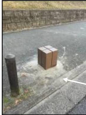
スツールテーブル