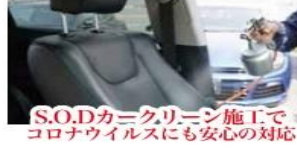
S.O.Dカークリーニング施工で コロナウイルスにも安心の対応