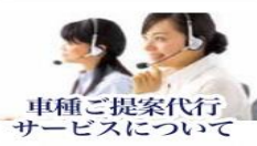
車種ご提案代行 サービスについて

あらかじめ打ち合わせした車輛返却の日時に、お客様ご指定の場所迄レンタカーをお引き取りに伺います。