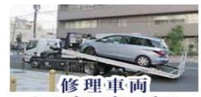
修理車両 レッカーサービス

スタッフがご担当者様に代わり代車をご利用になるお客様と直接お車の選定についてお話しすることも可能です。